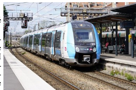
Arrivée d'une UM2 Francilien à la voie 3 de la Gare d'Aulnay-sous-Bois.

Une réunion dense et instructive, qui confirme une chose : la ligne K fonctionne, mais elle est arrivée à un point de saturation politique, territoriale et sociale. Les décisions à venir seront déterminantes pour l'avenir du territoire.