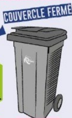
POUBELLE ORDURES MÉNAGÈRES

CES DÉCHETS NE DOIVENT PAS ÊTRE JETÉS DANS LA POUBELLE À COUVERCLE JAUNE (DÉCHETS RECYCLABLES).