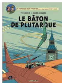
Blake et Mortimer